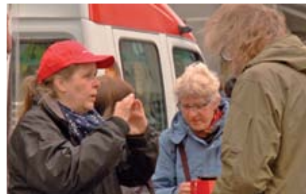
Faglig aktion på gaden i Århus